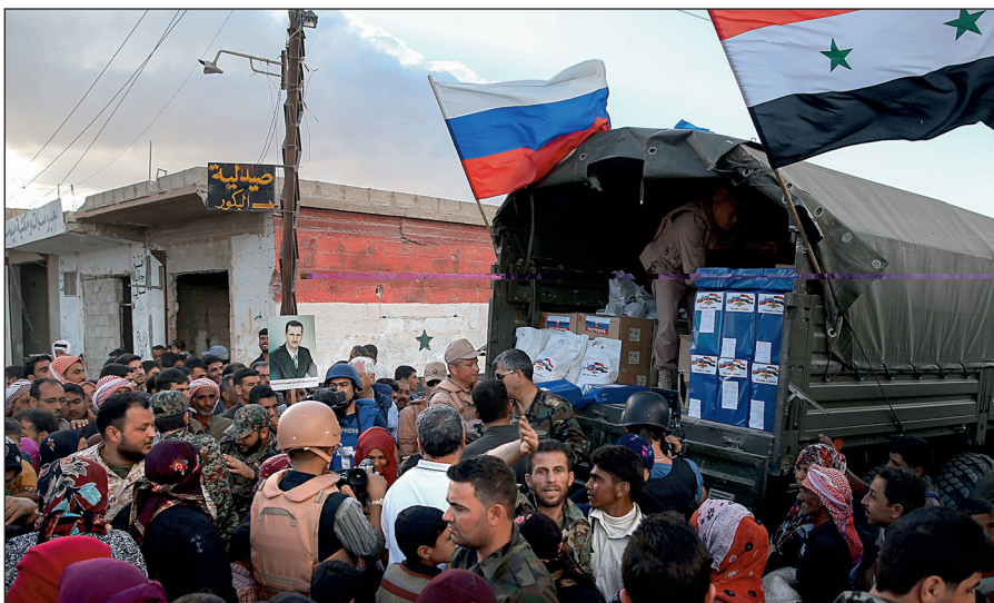
Россия оказывает гуманитарную помощь Сирии.