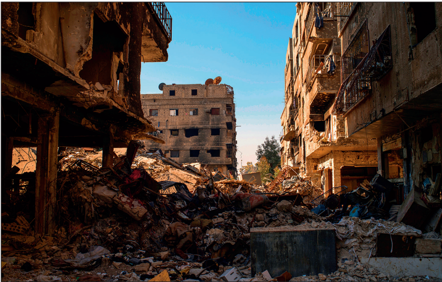
Разрушенный боевиками ИГИЛ Дамаск.

Террористы поставили на поток производство видеороликов с жестокими сценами казней пленников, заложников и «вероотступников». Эти материалы потом широко распространяются в социальных сетях и