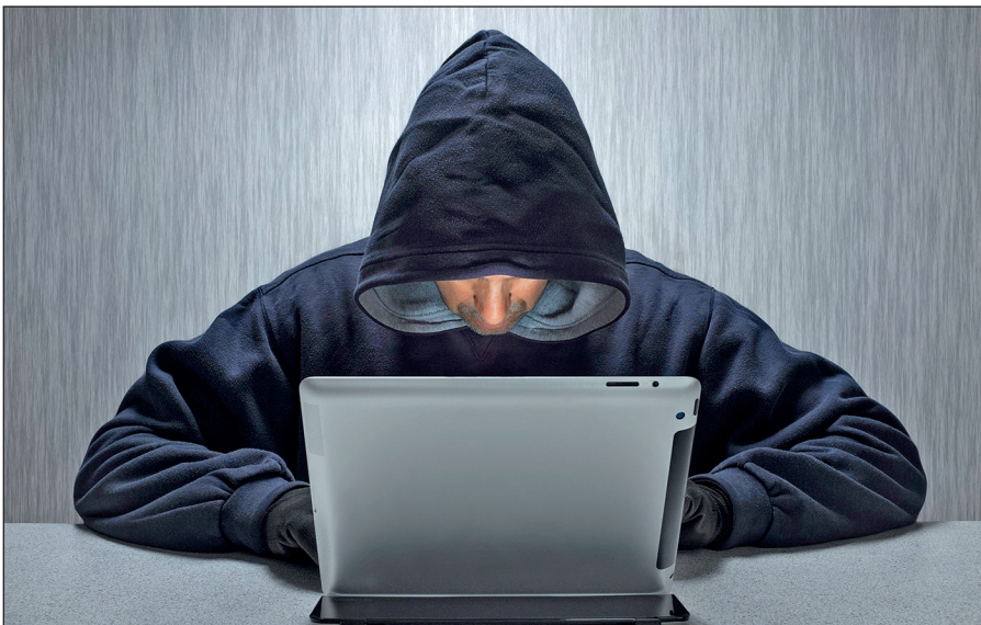
Вербовщики ИГИЛ активно используют Интернет.

Террористы день ото дня совершенствуют методы вербовки новых сторонников, а также алгоритмы их идеологической обработки. Читателю стоит помнить, что те типовые ситуации, которые описаны в данном пособии, можно рассматривать лишь в качестве базовых ориентиров,