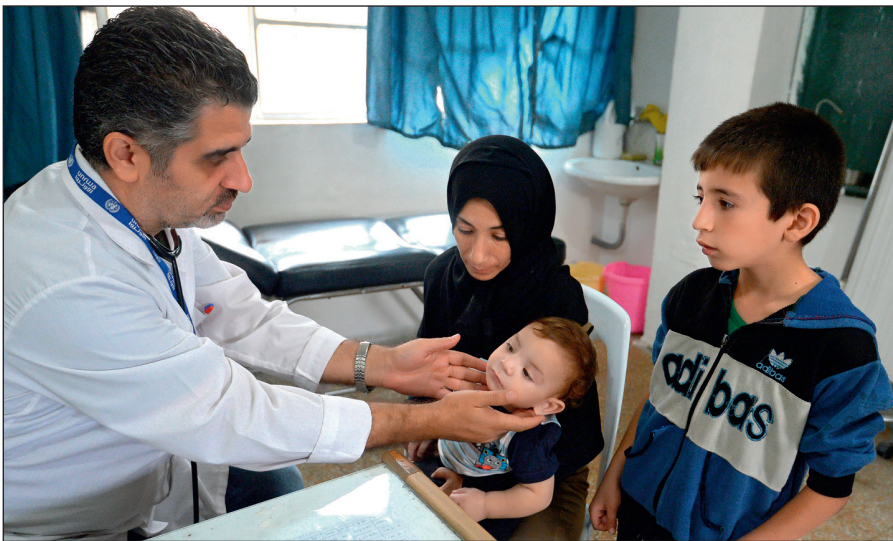
Истинный ислам призывает к состраданию и милосердию. Врач осматривает ребенка в медицинском пункте лагеря при одной из школ Дамаска.

Радикалы объявляют «врагами ислама» всех несогласных с ними мусульман. Ультрарадикальные группировки признают террор и насилие единственным способом достижения провозглашенных ими целей.