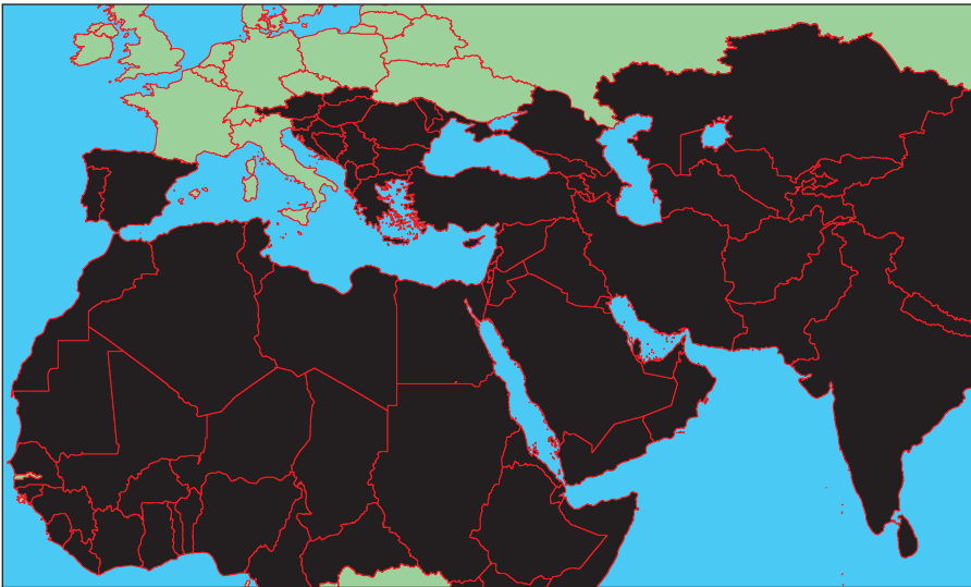
Карта мироустройства ИГИЛ

В настоящий момент группировка контролирует часть территории Сирии, а также ряд провинций в Ираке.