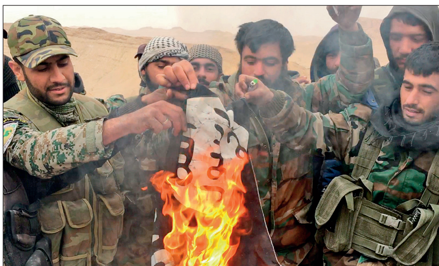
Народные ополченцы САР сжигают флаг ИГИЛ, снятый с отбитой у боевиков цитадели Пальмира.

Современное государство обязано защищать интересы каждого своего гражданина вне зависимости от его расы, национальности, принадлежности к определенной конфессии или религиозной традиции, в то время как ИГИЛ выражает интересы небольшой группы религиозных радикалов, жестоко подавляя остальную часть населения посредством запугивания, насилия и террора.