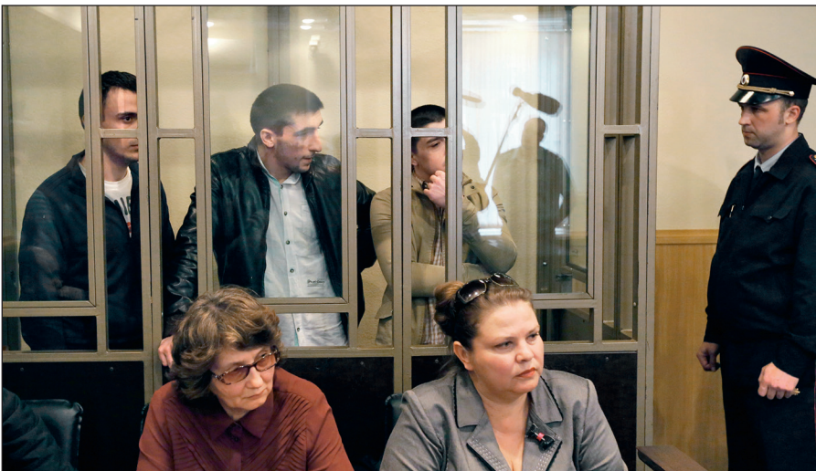
В Российской Федерации предусмотрена административная и уголовная ответственность за пропаганду идей терроризма, участие в деятельности террористических организаций.