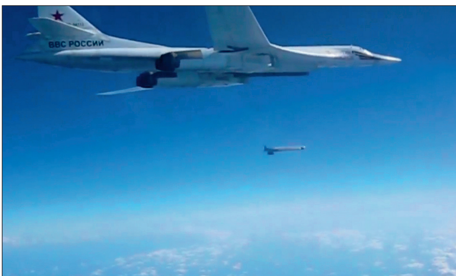
Воздушная операция российских ВКС по уничтожению боевиков ИГИЛ в Сирии.