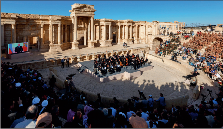
Освобожденная Пальмира. На концерте симфонического оркестра петербургского Мариинского театра под руководством народного артиста России Валерия Гергиева в Римском амфитеатре сирийской Пальмиры, освобожденной от террористов ИГИЛ.